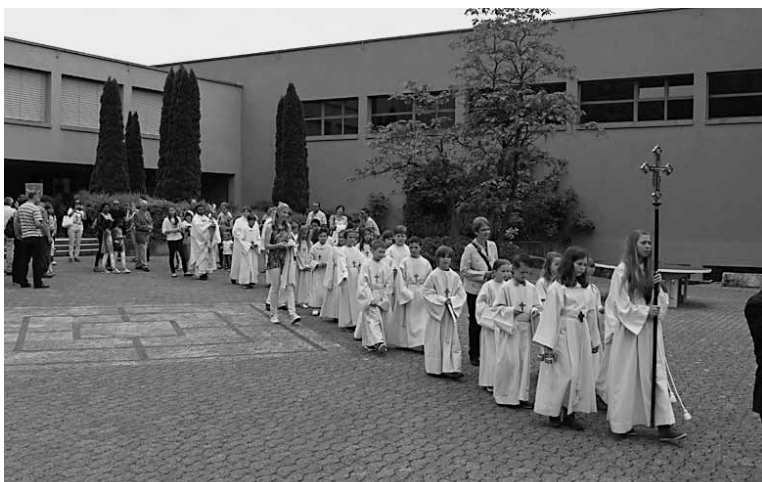
Fronleichnam als Dankgottesdienst für die Erstkommunionkinder von Thal und Rheineck. Der Prozessionsweg wurde vom Musikverein begleitet.