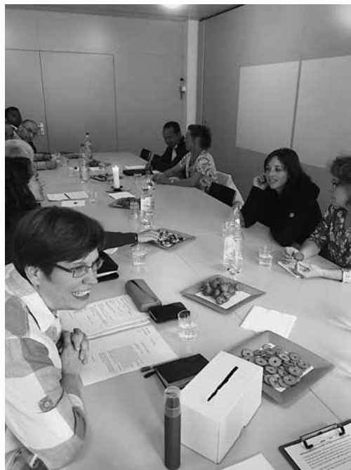
Vollversammlung der Pfarreiräte

Der Firmweg bietet Schritt für Schritt jungen Er-