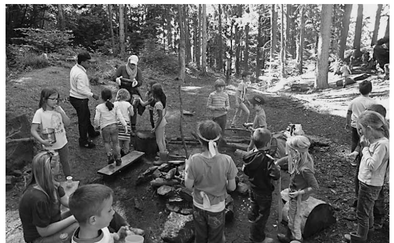
Ein spannender Kindernachmittag mit Schatzsuche führte dieses Mal zum Burgstock.